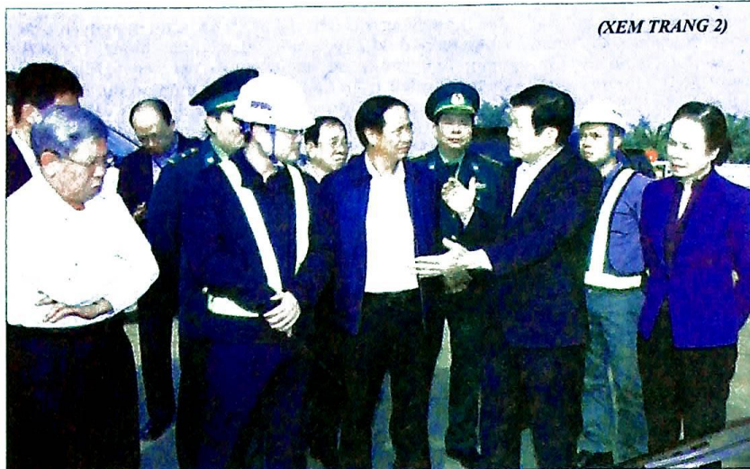
Đồng chí Trương Tấn Sang, nguyên Ủy viên Bộ Chính trị, nguyên Chủ tịch nước cùng các đồng chí lãnh đạo thành phố thăm Dự án cảng cửa ngõ quốc tế Lạch Huyện- Hải Phòng.