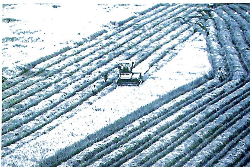
Cần tích tụ ruộng đất để tiến hành sản xuất nông nghiệp theo quy mô lớn.

Để giải quyết vướng mắc của các DN, Bộ trưởng Bộ Nông nghiệp và Phát triển nông thôn Nguyễn Xuân Cường khẳng định: "Các chính sách thu hút đầu tư nông nghiệp thời gian tới sẽ mang tính đột phá và sát thực tiễn để DN yên tâm đầu tư..."