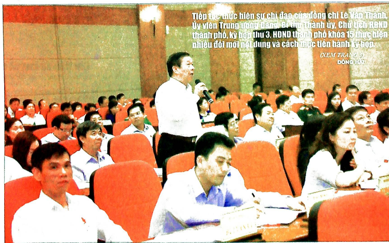
Tiếp tục thực hiện sự chỉ đạo của đồng chí Lê Văn Thanh, Ủy viên Trung ương Đảng, Bí thư Thành ủy, Chủ tịch UBND thành phố, kỳ họp thứ 3, HĐND thành phố khóa 15 thực hiện nhiều đổi mới nội dung và cách thức tiến hành kỳ họp. (XEM TRANG 3) ĐỒNG HẢI